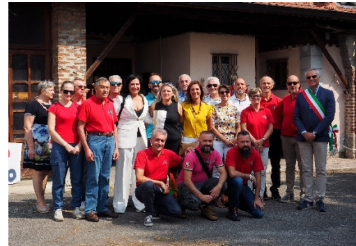
Festa del Donatore 2022